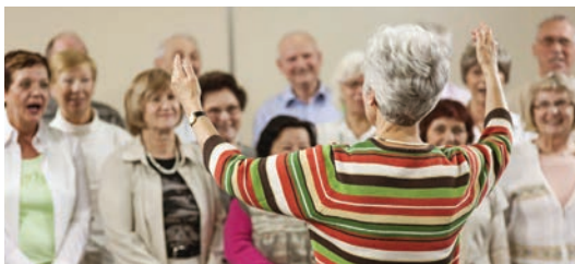
LE MAGAZINE DE L'ASSOCIATION DES RETRAITÉS ET RETRAITÉS DE L'ÉDUCATION ET DES AUTRES SERVICES PUBLICS DU QUÉBEC